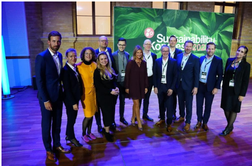
PwC Deutschland beim Sustainability Kongress 2023

Mehr als 250 Nachhaltigkeitsexpert:innen und Entscheider der unterschiedlichsten Branchen nahmen am diesjährigen Sustainability Kongress am 18. und 19. Oktober in Berlin teil. Als Hauptkongresspartner hatten wir mit PwC Deutschland die Gelegenheit, den spannenden Austausch zwischen Wirtschaft und Politik zu begleiten. Meine Key Insights und Learnings habe ich in einem Recap zusammengefasst.