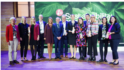
Gewinner des Building Public Trust Awards (BPTA)