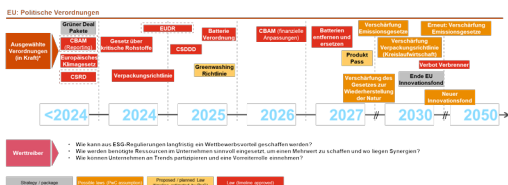
Abbildung 1 Entwicklung politischer Verordnungen in der EU in den nächsten Jahren.

Wenn es um Nachhaltigkeits-Regularierungen geht, gibt es einige zentrale Vorschriften, die Unternehmen unbedingt beachten sollten. Dazu gehören die Corporate Sustainability Reporting Directive (CSRD), das Lieferkettensorgfaltspflichtengesetz (LkSG) und dessen EU-Pendant, die Corporate Sustainability Due Diligence Directive (CSDDD), sowie die EU-Abholzungsverordnung (EUDR) und der Carbon Border Adjustment Mechanism (CBAM). Diese Regularierungen sind nicht nur bürokratische Hürden, sondern spielen eine entscheidende Rolle bei strategischen Unternehmensentscheidungen. Sie beeinflussen, wie sich Unternehmen langfristig erfolgreich und zukunftsfähig aufstellen. Indem Sie diese Vorschriften nicht nur erfüllen, sondern aktiv in Ihre Geschäftsstrategie integrieren, können Sie Ihre Marktposition stärken, Risiken minimieren und neue Geschäftsmöglichkeiten erschließen.