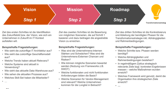
Abbildung 2: 3-Step-Approach hin zur Transformationsstrategie

Mit unserem 3-Step-Approach wird die Transformationsstrategie in drei Schritten definiert. Dieser Ansatz wird an die jeweiligen Besonderheiten des Projektes angepasst: