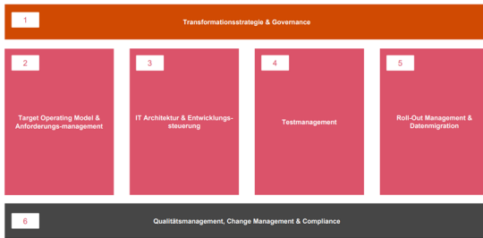
Abbildung 1: IT Transformation Framework

Um die Anforderungen aus der formulierten Transformationsstrategie zu veranschaulichen, ist eine Konzeption des Target Operating Models (TOM) elementar. Dabei gilt es, strategische Anforderungen an eine Organisation verständlich darzustellen. Auf Basis dessen legen wir mit einem effizienten und strukturierten Anforderungsmanagement den Grundstein für eine erfolgreiche Integration von Prozessen und Systemen in der IT unserer Kunden. Dabei sind TOM & Anforderungsmanagement eng miteinander verzahnt.