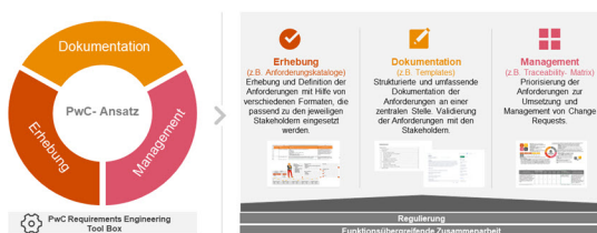
Abbildung 3: Der PwC Requirements Engineering Cycle

Systematische Validierung, Priorisierung und Umsetzung von Anforderungen