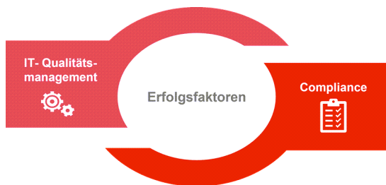
Abbildung 1: Verzahnung von IT- Qualitätsmanagement und Compliance

Unternehmen im Finanzsektor investieren verstärkt in IT-Transformationen, um wettbewerbsfähig zu bleiben, steigende Kundenerwartungen zu bedienen und regulatorische Anforderungen zu erfüllen. Mit einem effektiven IT-Qualitätsmanagement sowie der Implementierung eines Compliance-Programms, stellen wir die Qualität der IT-Systeme sicher und minimieren potenzielle Risiken in allen Phasen der Transformation.