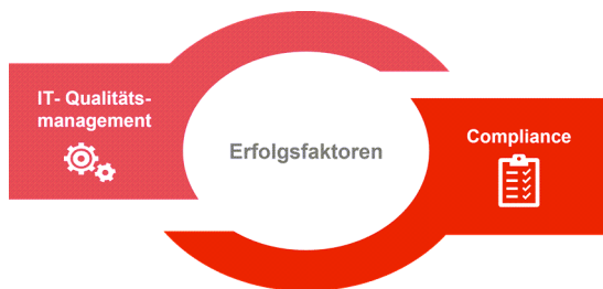
Abbildung 1: Verzahnung von IT- Qualitätsmanagement und Compliance

Unternehmen im Finanzsektor investieren verstärkt in IT-Transformationen, um wettbewerbsfähig zu bleiben, steigende Kundenerwartungen zu bedienen und regulatorische Anforderungen zu erfüllen. Mit einem effektiven IT-Qualitätsmanagement sowie der Implementierung eines Compliance-Programms, stellen wir die Qualität der IT-Systeme sicher und minimieren potenzielle Risiken in allen Phasen der Transformation.